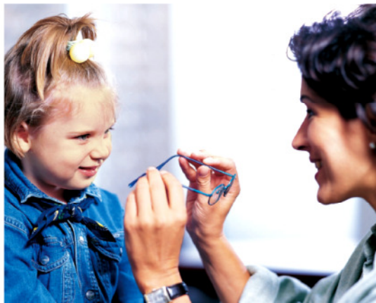
Beratung und Verkauf Einstärkengläser