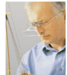
Beratung & Verkauf Zusatzprodukte