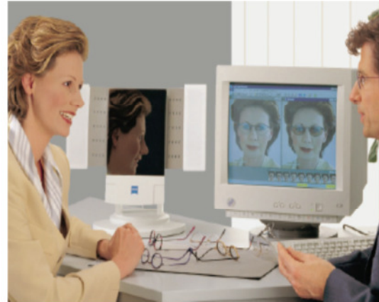
Beratung und Verkauf Mehrstärkengläser